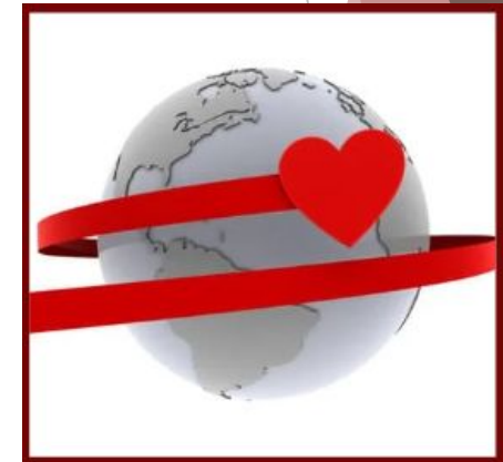
Equidad y Aprendizaje Socioemocional