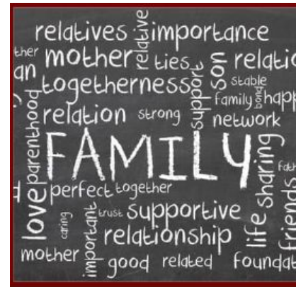
Participación Familiar y Comunitaria