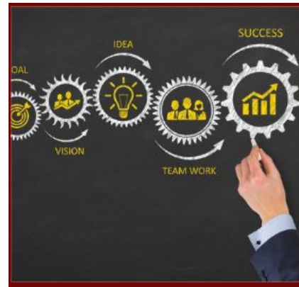
Sistemas y Estructuras para el Éxito