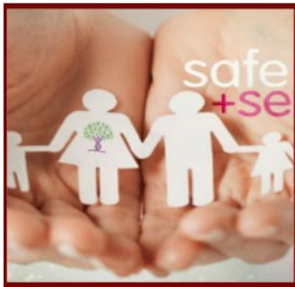
Ambientes Seguros y Protegidos

Este borrador de presupuesto 2023 - 2024 es reflexivo y con visión de futuro para avanzar en nuestros pilares esenciales.