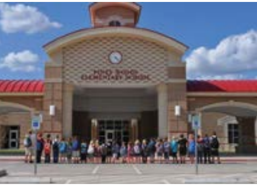
PINEY WOODS ELEMENTARY