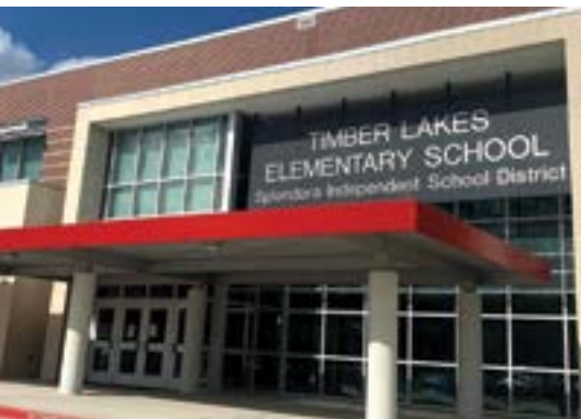
TIMBER LAKES ELEMENTARY