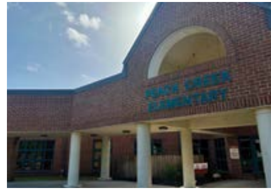
PEACH CREEK ELEMENTARY