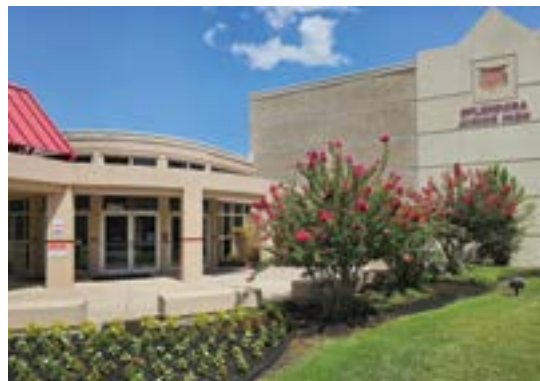
SPLENDORA JUNIOR HIGH