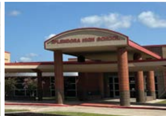
SPLENDORA HIGH SCHOOL