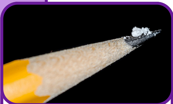
Una dosis letal de fentanilo

La sobredosis puede causar estupor, cambios en el tamaño de las pupilas, piel húmeda y húmeda, cianosis, coma e insuficiencia respiratoria que puede llevar a la muerte. La presencia de una tríada de síntomas como coma, pupilas contraídas y depresión respiratoria sugiere firmemente una intoxicación por opiodes.