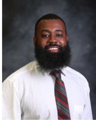
Assistant Athletic Director