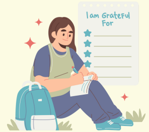
Practicar la gratitud

LA SALUD MENTAL ES TAN IMPORTANTE COMO LA SALUD FÍSICA. SÓLO PORQUE NO PUEDES VERLO NO SIGNIFICA QUE NO ESTÉ AHÍ.