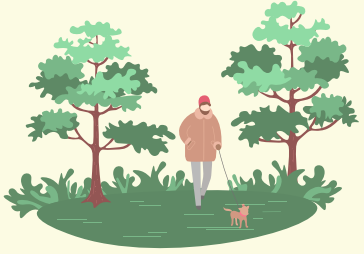
Pasar tiempo en la naturaleza

Estrategias prácticas de afrontamiento para el bienestar diario.