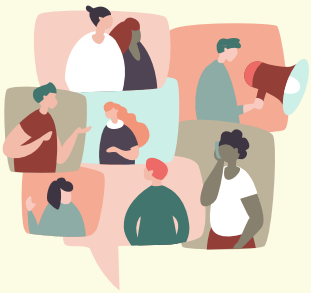
Connect with others