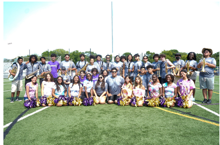
Estudiantes de último año de la banda musical de Central Islip