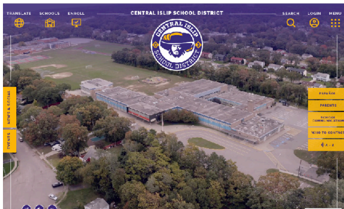
Nuevo sitio web

Correos electrónicos semanales: los miembros de la comunidad ahora pueden optar por suscribirse y registrarse para recibir nuestros “Próximos eventos” y “Noticias y Resumen de anuncios” mediante correos electrónicos. Visite https://centralislip.k12.ny.us/emails para obtener más información.