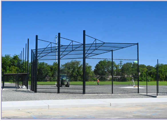
Espacios exteriores mejorados