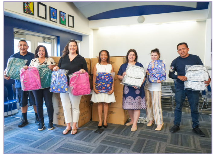
Donación de útiles escolares de Costco