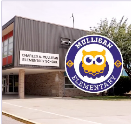
Nuevos videos informativos