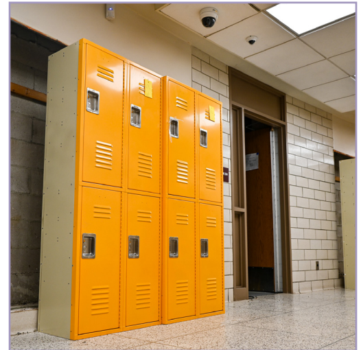
Nuevos casilleros para la escuela

comunicarse con el maestro(a) del salón de clases de su hijo(a) o el director(a) de la escuela si tiene alguna pregunta o inquietud.