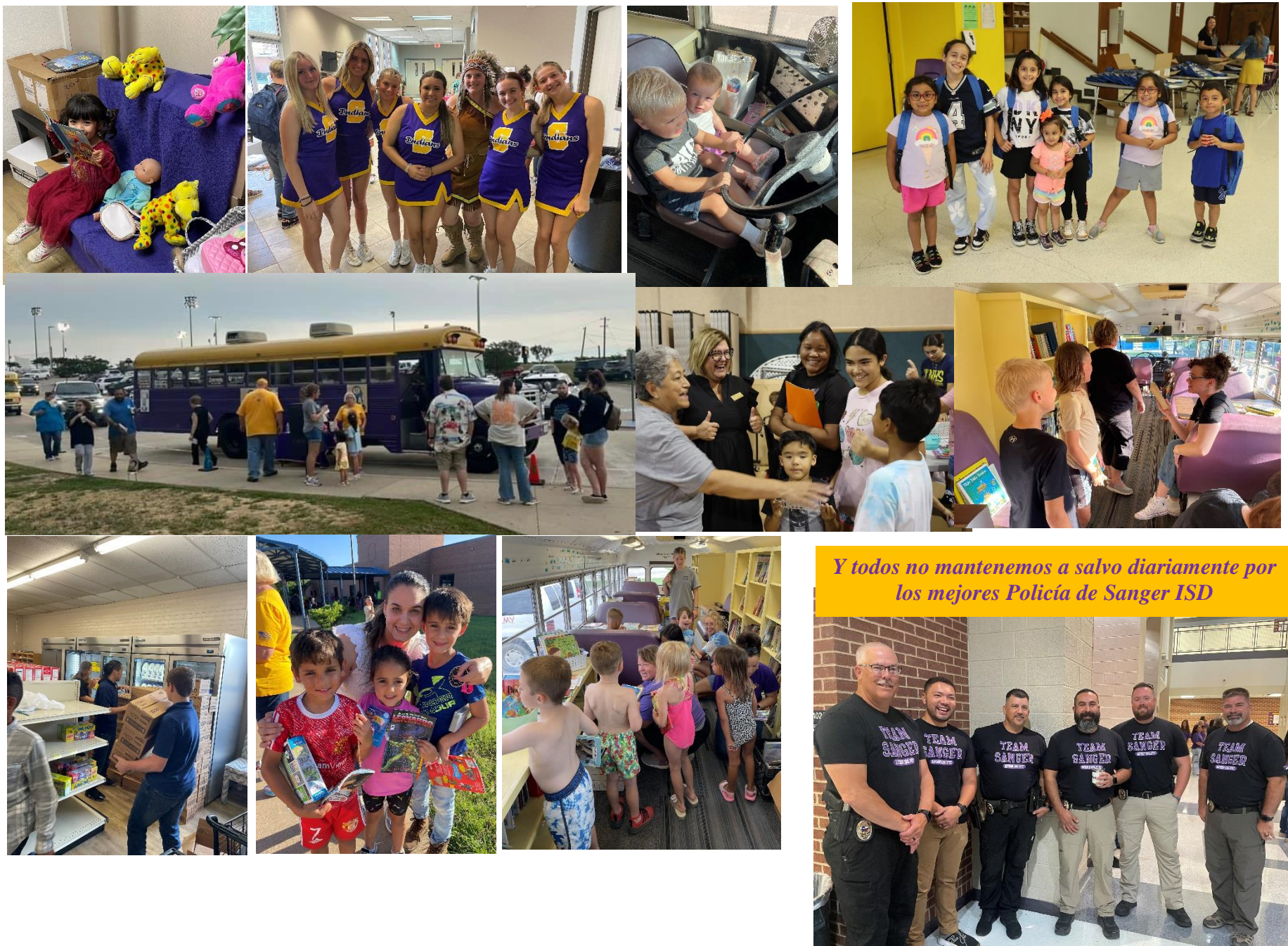
Y todos no mantenemos a salvo diariamente por los mejores Policía de Sanger ISD