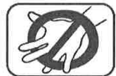
6. Don't hold down.