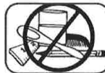
5. Don't put anything in mouth.