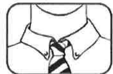
2. Loosen tight clothing.