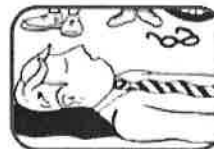
1. Cushion head, remove glasses.