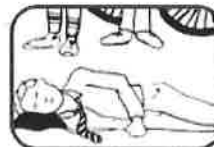
3. Turn on side and keep airway clear.