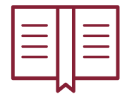
Manual para estudiantes y padres