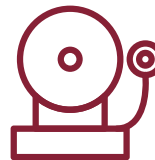
Horarios de timbre