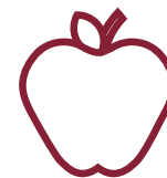
Servicio de comida