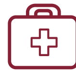
Servicios de salud