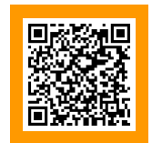
Download the App for Android

*You can opt-out by adjusting notification preferences in your “Account Settings”. Please note that certain urgent messages will continue to be delivered to your devices regardless of opt-out.