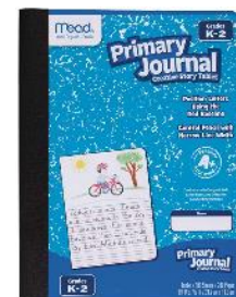
*Primary composition notebook/ journal