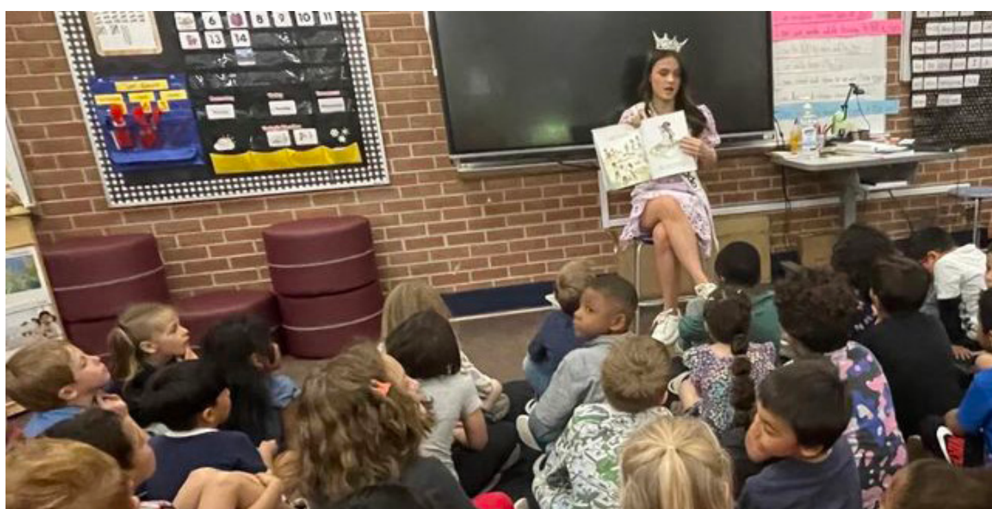
Durante el año escolar 2023-2024, los estudiantes de Inglés y Matemáticas tuvieron un aumento de casi un 10 por ciento en los puntajes de las pruebas.