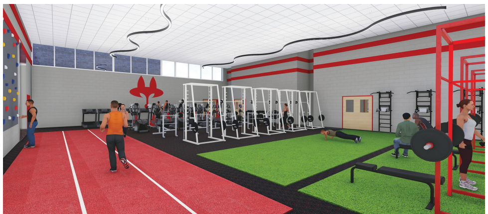
CENTRO DE BIENESTAR PARA FOX LANE HIGH SCHOOL

Para más información acerca del bono, escanee el código QR o visite bcsdny.org/