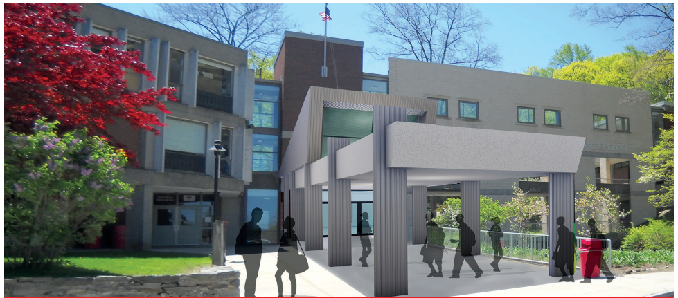
ENTRADA A FOX LANE MIDDLE SCHOOL

LA PROPUESTA 2 SOLO PUEDE SER APROBADA SI LA PROPUESTA 1 ES APROBADA