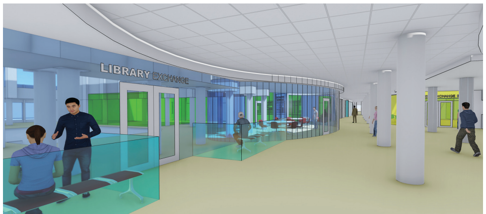
AREA DE APRENDIZAJE EN FOX LANE HIGH SCHOOL