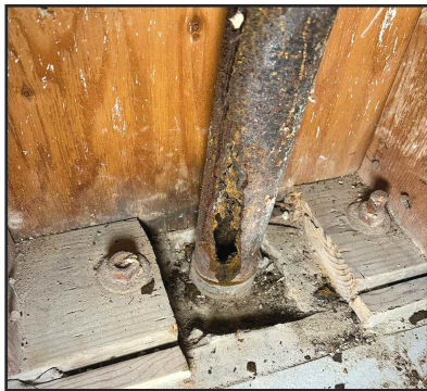
Centro Casita - Tuberías oxidadas