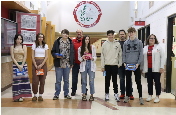
Ganadores de la copa Bulldog de la segunda semana de febrero

Para comenzar con el pie derecho, desafiamos a nuestros estudiantes a otro Desafío de Llegar a Tiempo y la clase de último año estaba decidida a ganar. En las primeras dos semanas de nuestro desafío, los estudiantes de último año se convirtieron en líderes evidentes y mantuvieron su ventaja durante la semana final. Con solo 220 tardanzas, los estudiantes de último año aseguraron su victoria con una fiesta de helados y puntos para la copa Bulldog. Si bien estos estudiantes están ganando un premio a nivel del grado, contamos con premios individuales para otorgar. Todos los estudiantes que no hayan llegado tarde durante el curso del desafío participarán de una rifa para ganar entradas para el baile de invierno. Síguenos en Twitter ( @KeepingItRED ) para conocer las novedades sobre los ganadores del desafío.