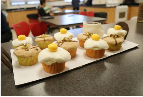
Preparación de alimentos

En todas nuestras clases del Departamento de CTE, trabajamos para abrir puertas a oportunidades para que nuestros estudiantes estén listos para la universidad y la carrera profesional. Ya sea que quieras especializarte en carpintería o manufactura y estés analizando nuestras clases de carpintería; arreglar motores pequeños en nuestras clases de Exploración Tecnológica; aprender habilidades culinarias en nuestros cursos de Preparación y Nutrición de Alimentos; o crear la próxima generación de aplicaciones para iPhone en nuestro curso de Diseño de Aplicaciones Móviles, tenemos un camino a seguir para cada estudiante.