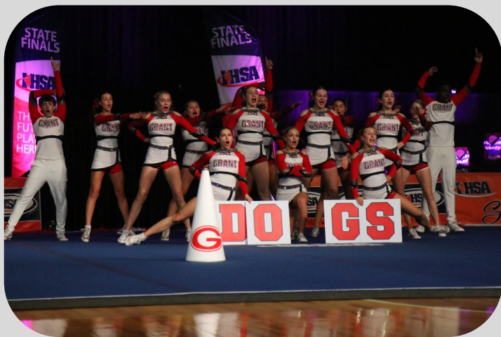
El equipo de animadores de Grant actúa en las finales estatales de animación de la IHSA.