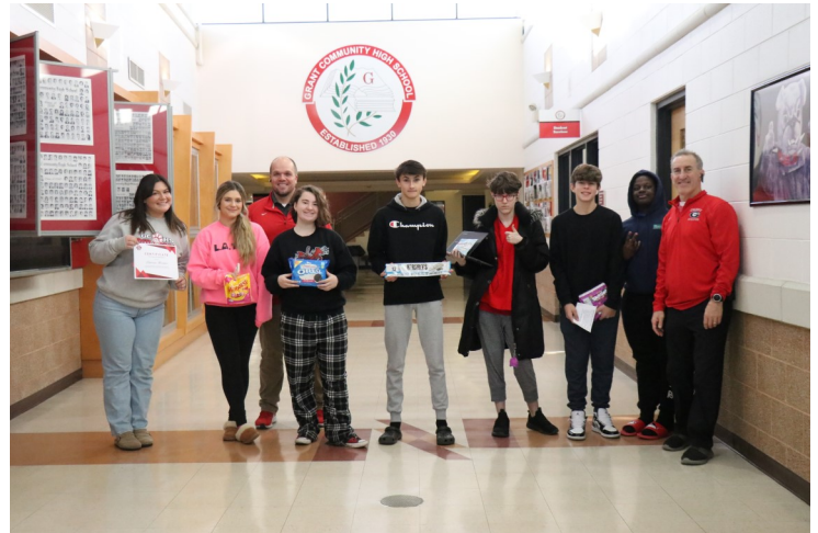
Ganadores de la copa Bulldog del segundo trimestre