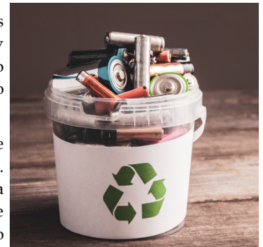
Contenedor de reciclaje de pilas

Para ayudar a detener esta destrucción del medio ambiente, el club ha colocado varios contenedores de basura en toda la escuela para que los estudiantes y el personal puedan desechar sus pilas correctamente. Cuando los contenedores estén llenos, el Club Medioambiental trabajará con Gestión de Desechos para recoger las pilas. Si tienes pilas AA, AAA, C, D o de 9 voltios, pasa por TSI, la biblioteca, el laboratorio de matemáticas o la sala de profesores y deposítalas en el contenedor. Al hacer tu parte para cuidar el medio ambiente, podemos teñir todo de ROJO y VERDE al mismo tiempo.