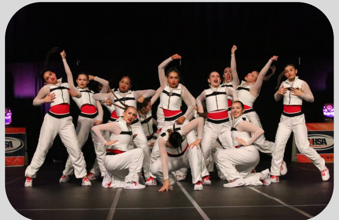
El equipo de baile de Grant actúa en las finales estatales de baile de la IHSA.

No solo obtuvieron el título de campeones de la NLCC 2024, sino que, por segunda vez en la historia de Grant, ¡también fueron nombrados campeones seccionales! Durante ambos días de la competencia estatal de la IHSA, lo dieron todo en sus actuaciones y lo dejaron todo arriba del escenario. Con mejoras en las puntuaciones a medida que avanzaba el fin de semana, el equipo terminó la temporada estatal bien arriba. Ahora, se están enfocando en las nacionales. ¡Asegúrate de seguir a @GrantDanceTeam en Instagram para conocer las novedades sobre su viaje a las nacionales!