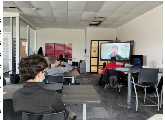
Fabricante de teléfonos móviles

estudiantes pueden tomar una idea para un producto y desarrollar su plan de negocios a través del “modelo de inicio ágil”. A medida que avanzan, nuestros estudiantes pueden interactuar con casi veinte profesionales y líderes del sector para aprender de primera mano cómo establecer y administrar un negocio. Nuestros estudiantes dan a conocer sus planes en presentaciones de productos mínimos viables y, luego, nuevamente en una presentación final ante nuestra