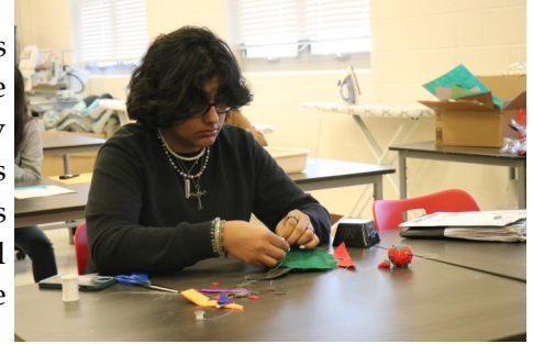
Fabricación de moda