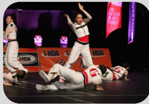
Arriba y abajo: El equipo de baile de Grant actúa en las finales estatales de baile de la IHSA.