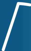
Parte del objeto