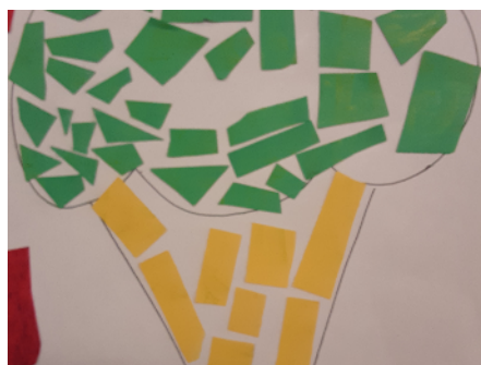
Imagen de la derecha: Helado de mosaico en progreso