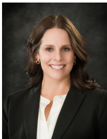
Brittany Gledhill Representante Legislativo, Posición 4