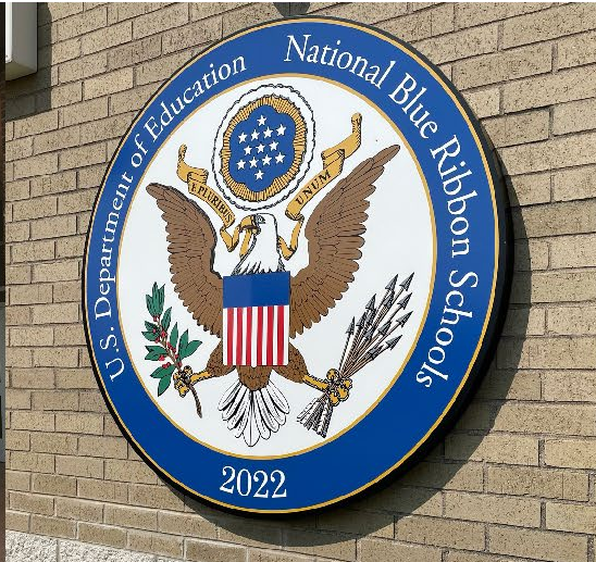
بالوس ويست مدرسة ذات شريط أزرق 2022