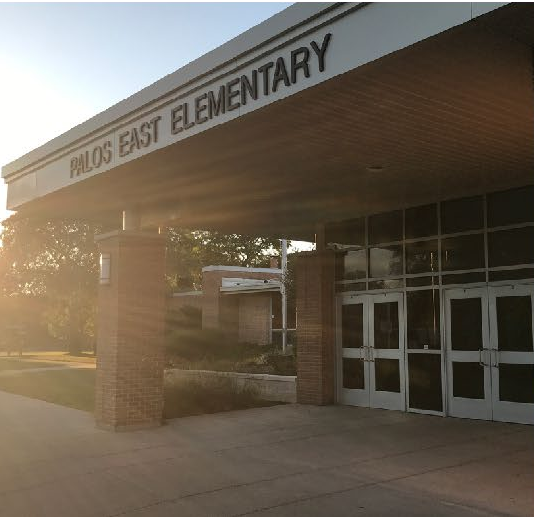
بالوس إيست مدرسة نموذجية 2020