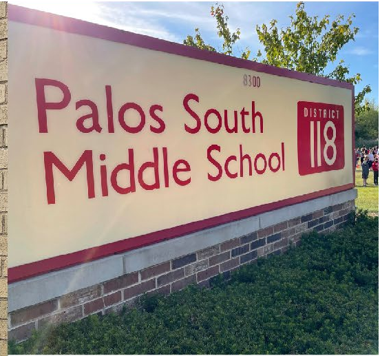
بالوس ساوث مدرسة نموذجية 2023