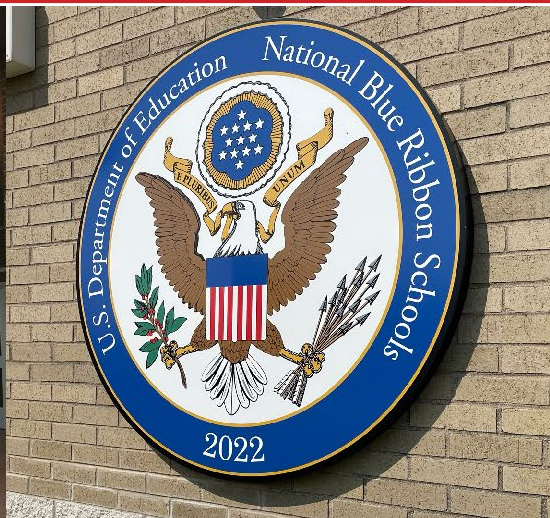
Palos West ESCUELA DE LA CINTA AZUL 2022