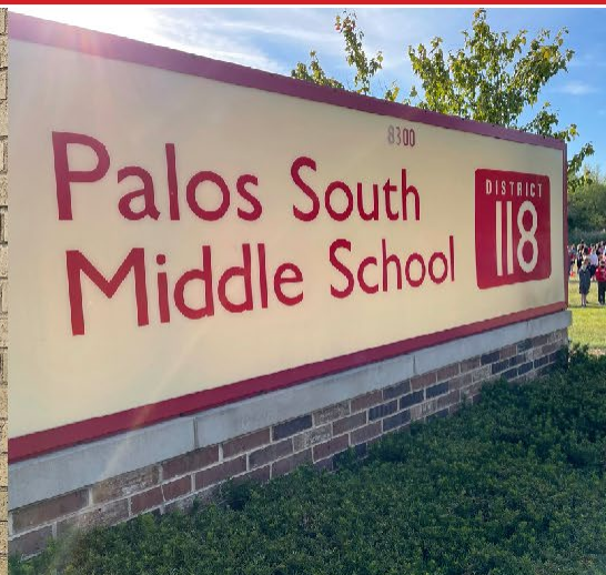
Palos South EXEMPLARY SCHOOL 2023