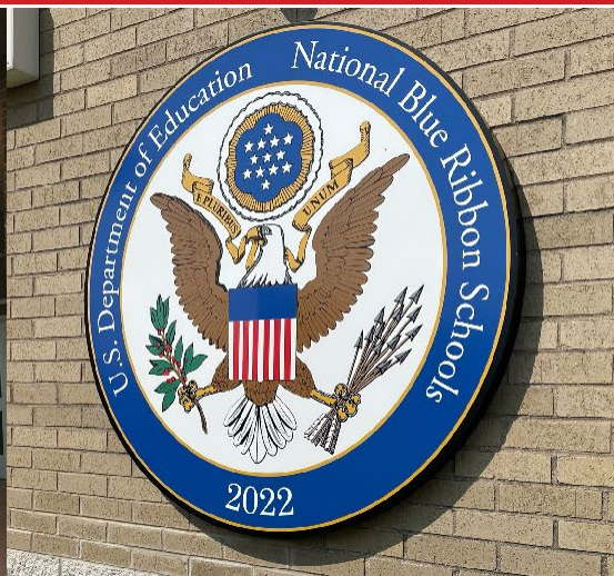
Palos West BLUE RIBBON SCHOOL 2022