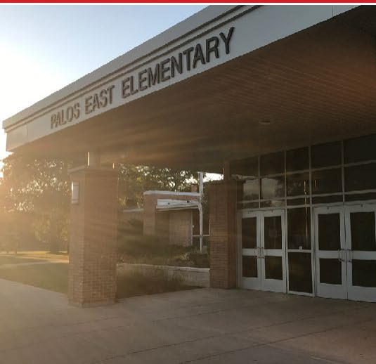
Palos East EXEMPLARY SCHOOL 2020