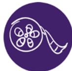
Arte, Medios y Entretenimiento