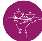
Hospitalidad, Turismo y Recreación