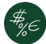
Negocios y Finanzas