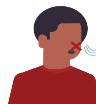
MÁT VỊ GIÁC HOẶC MÙI