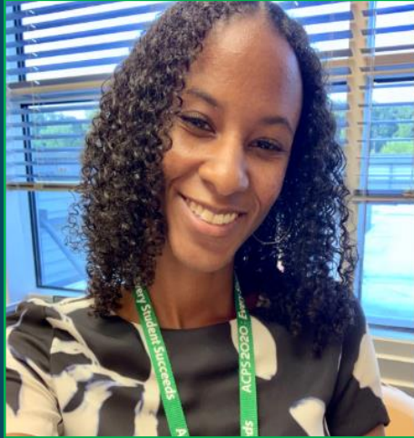
خانم گرین A-K