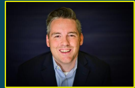
آقای برانون آکادمی بین المللی