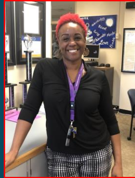
Ms. Neptune Social Worker K-Z