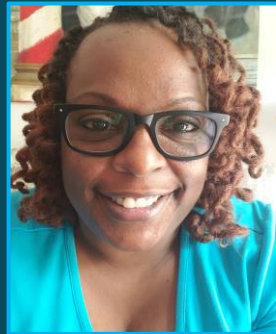
خانم فد صنف هفتم