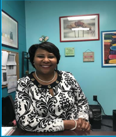
خانم واشنگتن A-K