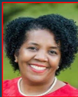
حانم بی مدیر شاگردان صنف ششم

به شاگردان کمک می نمایند تا مقررات مکتب را درک کنند و مشکلات را به روش های سالم حل کنند.