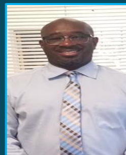
قای جکسون مدیر شاگردان صنف هفتم صنف هشتم