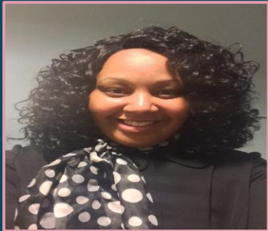
دکتر برد صنف ششم