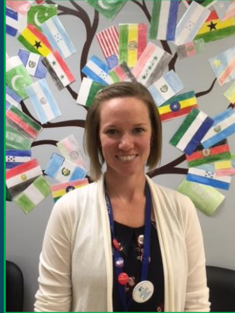
أكادمي بين المللي خانم ميگليوريني