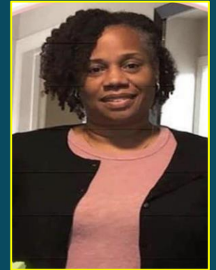
Ms. Reeves School Nurse