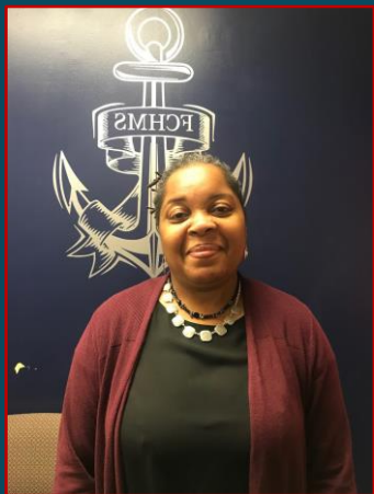
Ms. Jackson A-I

کمک به شاگردان در انتقال به لیسه، حل مشکلات به روش های سالم، موفقیت در تحصیل