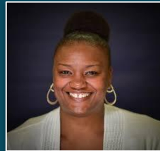
خانم فرای صنف هشتم