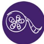
Arte, Medios y Entretenimiento