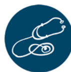
Ciencias de Salud Tecnología Médica