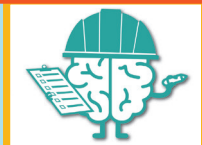
memoria de trabajo