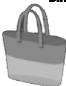
BOLSA DE MALLA