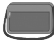
ESTUCHE PARA COMPUTADORA