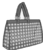
BOLSOS PLÁSTICOS CON DISEÑOS