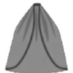
BOLSAS DE CORDON (CINCH)