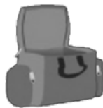
ESTUCHE PARA CAMERA