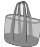
BOLSOS DE MANO GRANDES