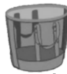
BOLSONES PLÁSTICOS DE COLOR