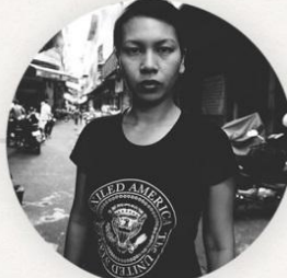
MY ASIAN AMERICANA Studio Revolt Project 6 នាទី