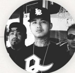
ជាប់ ឬ ធ្លាក់ នៅទីក្រុងខ្មែរ 30 នាទី