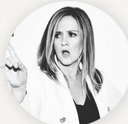
SAMANTHA BEE ឱកាសបង្ហាញស្នាដៃដោយជ័យ មួយចុងក្រោយ | 6 នាទី