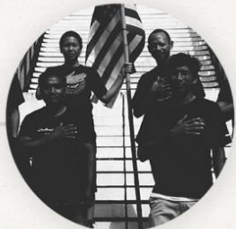
បញ្ជូនទៅឱ្យអ្នកបញ្ជូនវិញ Studio Revolt Project 8 នាទី

ចំណាំ៖ វីដេអូទាំងអស់ គឺមាន នៅលើ Youtube ផងដែរ។