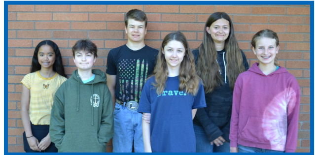
Estudiantes del Mes de Mayo

Todos los estudiantes son elegibles para recibir un anuario gratis. Las cuentas de los estudiantes deben tener un saldo de $0 para recibir un anuario. Las facturas de los estudiantes se enviaron por correo con las boletas de calificaciones del tercer trimestre. Consulte con la oficina si tiene alguna pregunta.