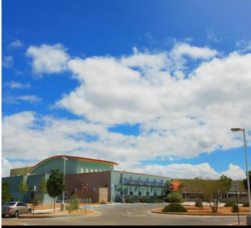
RUDOLFO ANAYA ELEMENTARY SCHOOL.