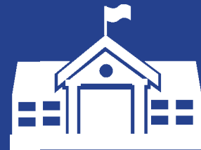
Школа с целевым классом