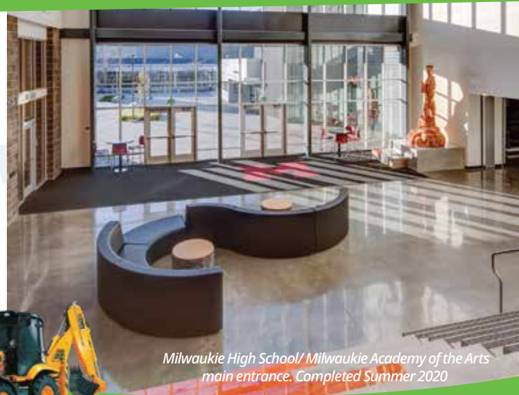
Milwaukie High School/ Milwaukie Academy of the Arts main entrance. Completed Summer 2020