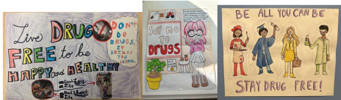
ዲዛይን የተደረጉ ፖስተሮች (Posters)ን ያቀረቡ፣ ከግራ-ወደ ቀኝ፣ ታስኒአ ራህማን (Tasniah Rahman)፣ ሃኒ ሎፔዝ (Honey Lopez) እና ሳራ ማክበርኒ (Sarah McBurney)።

ACPS፤ 5,000 የጭንቀት ኳሶች (stress balls)ን - ለትምህርት ቤት ሠራተኞች እና አስተዳደሮች - ከተማሪዎች ጋር እንዲያጋሩ፣ በ'Red Ribbon Week' ወቅት - አከፋፍሎ-የነበረ፤ እና የማህበረሰብ የክብ-ጠረጴዛንም ለመጀመሪያ-ደረጃ፣ መካከለኛ-ደረጃ እና ከፍተኛ ደረጃ ትምህርት ቤት ተማሪዎችም አከናውኖ-ነበር። እነዚህ የማህበረሰብ የክብ-ጠረጴዛ (community circles)፤ ተማሪዎች ለጤናማ ዕድገት የሚያስፈልጉ ርዕሶች ላይ ለመዳሰስ ረድቷቸዋል። እነዚህ በዳሰሳው-ዙሪያዎች የሚከተሉትን፤ የግንኙነት ችሎታዎች (communication skills)፣ የእኩዮቻቸው የሚመጣን ግፊትን መቋቋም፣ የአደንዛዥ-ዕጽ ነፃ ሆኖ የመቆየት ጥቅምን እና የአልኮል-መጠጥ፣ ኢ-ሲጋራ፣ ማርፎና፣ በሐኪም-የታዘዘ እና ከመድሃኒት ቤት ካለ-ሃኪም ትዕዛዝ የሚገዙ መድሃኒትን - ለመዝናኛነት ዓላማዎች (recreational purposes) ተብሎ-የሚታወቁትን - መጠቀም ለጤና እና ለማህበራዊ ሁኔታዎች ላይ ሊያመጣ-የሚችለውን ችግር፤ አካትቷል።