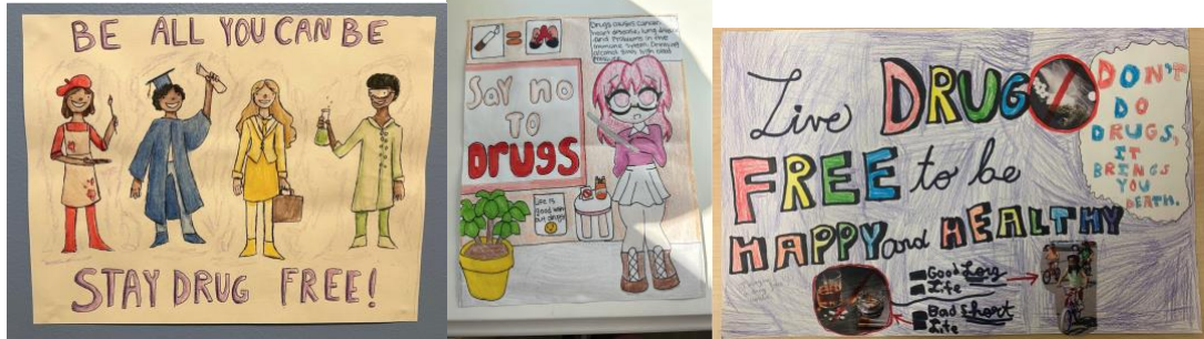
ملصقات من تصميم Sarah McBurney و Honey Lopez و Tasnia Rahman.

وزعت مدارس ACPS 5000 كرة ضغط على كادر المدرسة والمسؤولين الإداريين لغرض مشاركتها مع الطلاب خلال أسبوع الشريط الأحمر، كما نظمت أيضاً حلقات نقاشية مجتمعية لطلاب المدارس الابتدائية، المتوسطة والثانوية. ساعدت هذه الحلقات النقاشية المجتمعية الطلاب في التعرف على المواضيع الأساسية للتنمية الصحية. تشمل هذه المجالات مهارات التواصل، مقاومة ضغط الأقران، أهمية الإبتعاد عن تعاطي المواد المخدرة، العواقب الصحية والاجتماعية لاستخدام الكحول، السجائر الإلكترونية، الماريجوانا، الوصفات الطبية والأدوية التي لا تستلزم وصفة طبية لما يسمى بالأغراض الترفيهية.