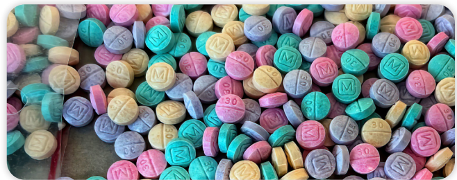
*Pastillas arcoíris FALSIFICADAS de oxycodona M30 que contienen fentanilo