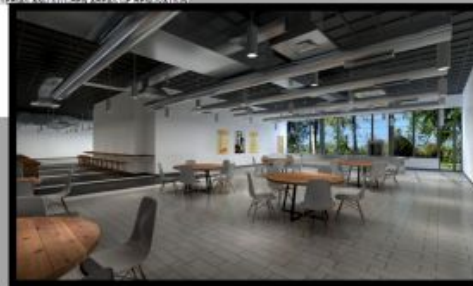
PROPOSED DESIGN REFERENCE