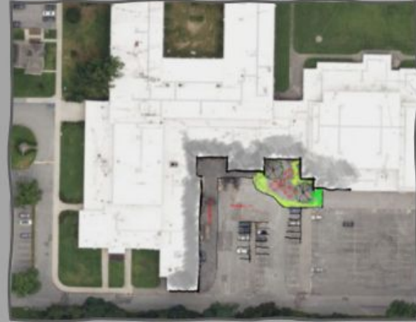
SENIOR OUTDOOR SEATING AREA