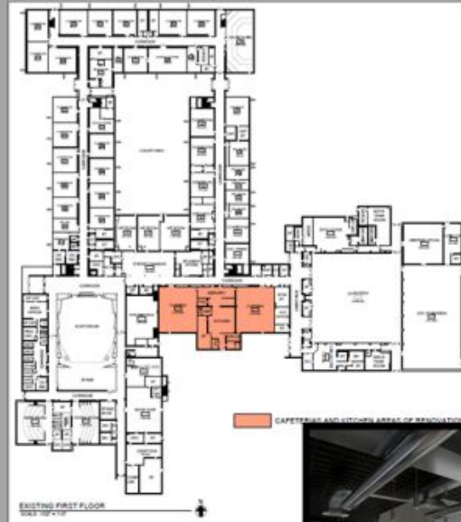
FLOOR PLAN AREA OF PROPOSED RENOVATION