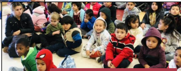
Asistiendo al concierto de Invierno