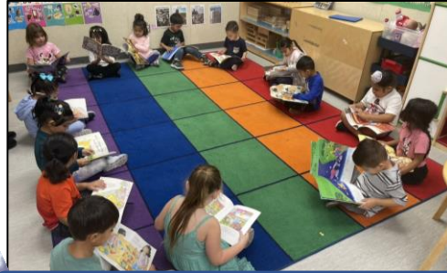
Estudiantes de Villalovoz leyendo los libros que sacaron de la biblioteca de la escuela.