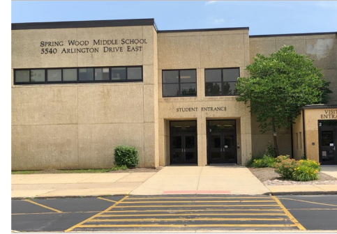
Середня школа Spring Wood Класи 6-8