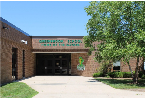
Початкова школа Greenbrook Класи К-5