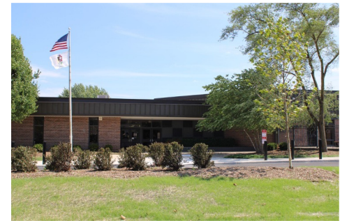
Початкова школа Waterbury Класи К-5