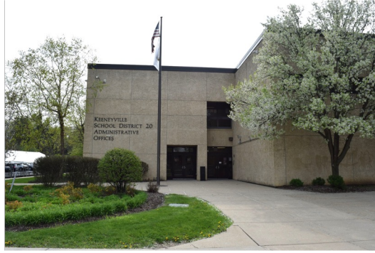
Адміністративний офіс округу