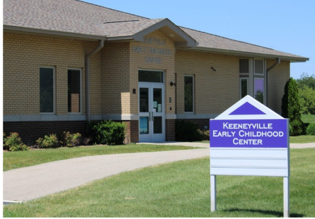
Центр раннього дитинства (ЕСС) Підготовка до дитячого садка