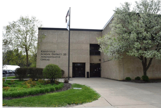
Oficina Administrativa del Distrito