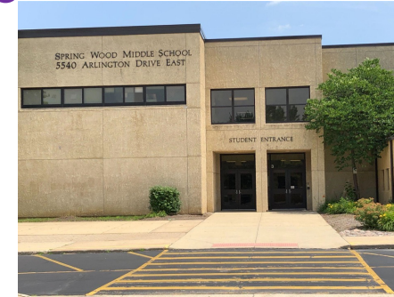
Escuela Intermedia Spring Wood Middle School Grados 6-8