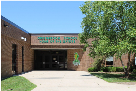
Escuela Primaria Greenbrook Grados K-5