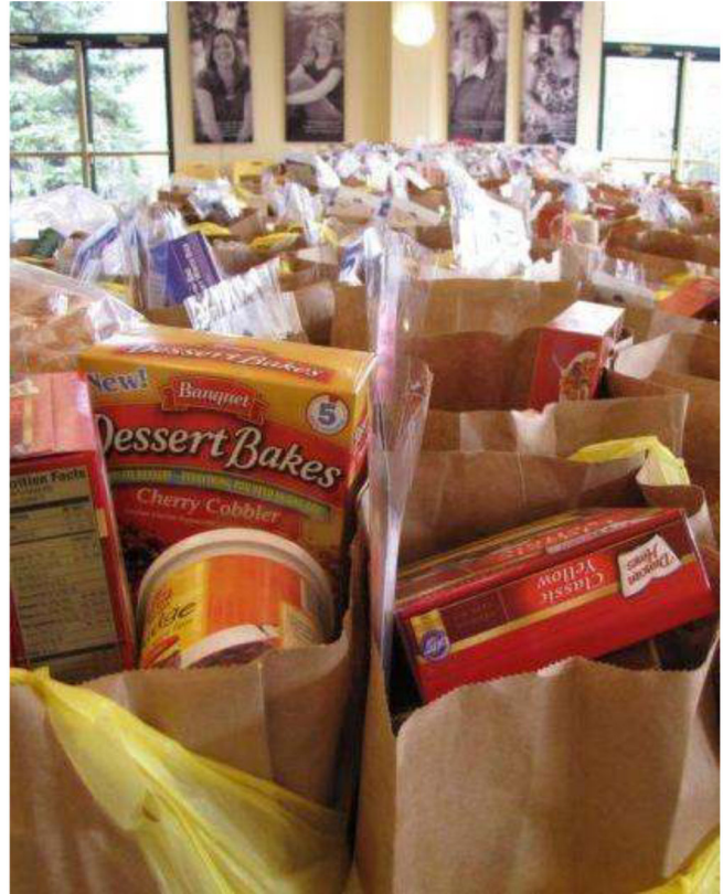
Des paniers repas préparés pour Thanksgiving dans le New Jersey

L'Action de grâce est célébrée le deuxième lundi d'octobre au Canada et le quatrième jeudi de novembre aux États-Unis et à peu près à la même partie de l'année ailleurs. Bien que Thanksgiving ait des racines historiques dans les traditions religieuses et culturelles, il a longtemps été célébré comme une fête laïque.