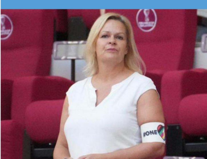
Une ministre allemande dans les tribunes du Stadium Khalifa pendant la rencontre Allemagne-Japon, portant le brassard "One Love" interdit par la FIFA.