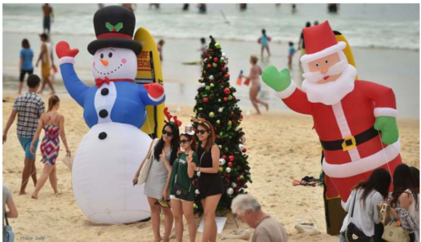
Christmas in Australia.

25 th of December isn't always celebrate with the same traditions. For example, stockings hung is more British. While Germany will see seasonal markets popping up all over the country, Japan will go KFC for instead of cooking a large diner ! When Australia is on summer months when Christmas hits, many residents will appreciate the beach for a barbecue.