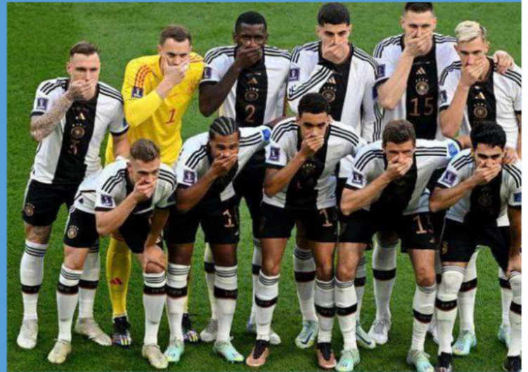
Les joueurs allemands posent avec la main devant la bouche avant leur match face au Japon, le 23 novembre 2022

« Personnellement, je ne la regarderai pas » - à déclaré l'ex-footballeur Eric Cantona pour le Daily Mail le 12 janvier 2021