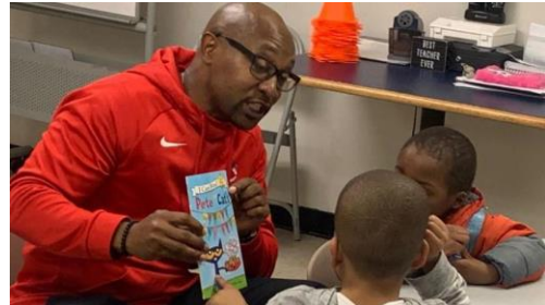
የአሌክሳንድሪያ ከተማ የሕዝብ ትምህርት ቤቶች (Alexandria City Public Schools (ACPS) - ተማሪዎቻችንን እና ቤተሰቦቻችንን በርካታ-የሆኑ ፍላጎቶች ምላሽ-ለመስጠት፣ የትምህርት ቤታችን ክፍል/division - ቁጥጥር-የሚደረግበት የክትምህርት-