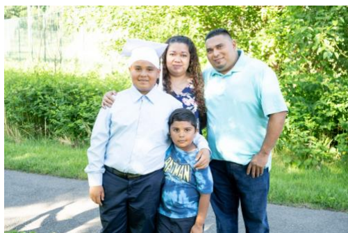
یک شاگرد به همراه خانواده خود در طول رویداد فارغ التحصیلی صنف پنجم Casa Chirilagua Kids Club