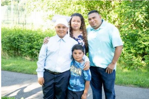
Un estudiante posa con su familia durante el evento de graduación de quinto grado del Kids Club de Casa Chirilagua.