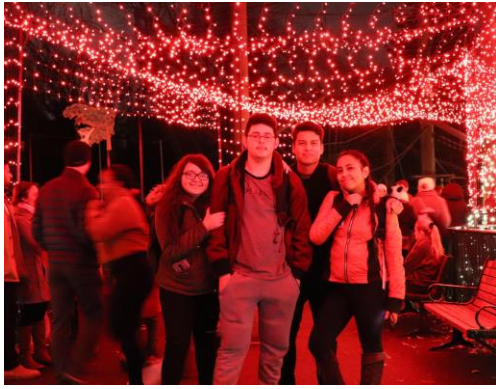
ተማሪዎች፣ የስሚትሶኒያ ብሄራዊ የዙዮሎጂካል ፓርክ (Smithsonian's National Zoological Park)ን እንደ 'Liberty's Promise Civic Engagement' በማድረግ ለእንግሊዘኛ ቋንቋን ለማሳደግ ፕሮግራም ጀምረዎች - ጉብኝት አድርገዋል