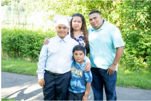
በካሳ ጅላጎዋ (Casa Chiralagua): የሕፃናት ክለብ (Kids Club) የ5ተኛ ክፍል የምርቃት ዝግጅት ጊዜ፤ ተማሪው ከቤተሰቦቹ ጋር የተነሳው ፎቶግራፍ።

የሚያዘጋጅ - የሙያ-ስልጠና ትምህርት ችሎታዎችን ይሰጣል። ጎሜዝ ሸልሃስ (Gomez Schellhaas) እንደአጠቃለሉት: “በ‘Casa’ የተሰጠው የመከራከት-አገልግሎት (mentorship) ዋጋው-ተገምግሞ አያልቅም።”