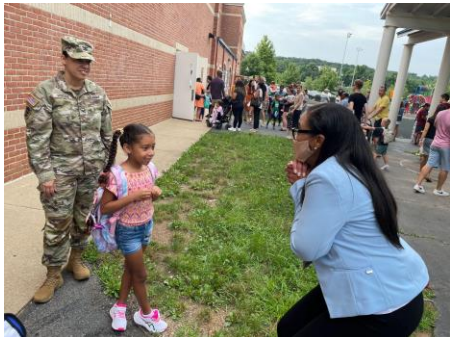
የአሌክሳንድሪያ ከተማ የሕዝብ ትምህርት ቤቶች (Alexandria City Public Schools (ACPS)፤ ለ2022-23 የትምህርት ዓመት ጠንካራ-የሆነ አጀማመር - ቤተሰቦቻችን የሚያስፈልጓቸውን መረጃዎች በቀላሉ እንዲያገኙ ለመርዳት እዚህ ይገኛል።