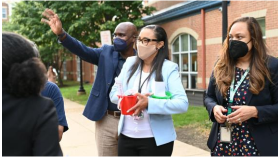
ውድ የACPS ቤተሰቦች፣ ተማሪዎች እና ሠራተኞች፤

በአሌክሳንድሪያ ከተማ የሕዝብ ትምህርት ቤቶች (Alexandria City Public Schools (ACPS) ውስጥ፣ ወደ አዲሱ የቀለም-ትምህርት ዓመት እንኳን በደህና መጣችሁ! ቀድሞ-ከነበሩን ጓደኞቻችን ጋር እና ከአዲሶቹ ጋር - ያደረግነውን ለማውራት ደስተኞች ነን። ለተማሪዎቻችን፣ ጉዞአቸውን ለወደፊት ለመምራት በሚረዳቸው የመማር ልምዳቸው ውስጥ - ወደ አዲስ ምዕራፍ የመሄጃ ጊዜው-አሁን ነው።