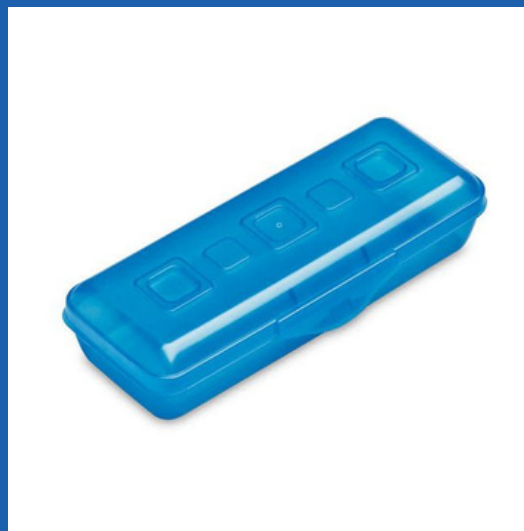
Pencil box Estuche de lápices