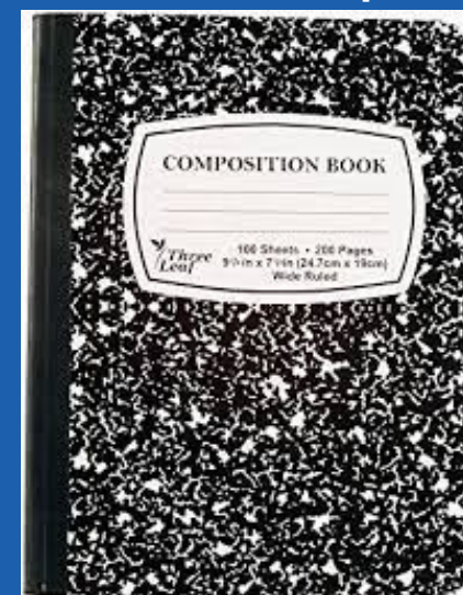
Composition Notebook (Second & Third) Cuadernos de composición