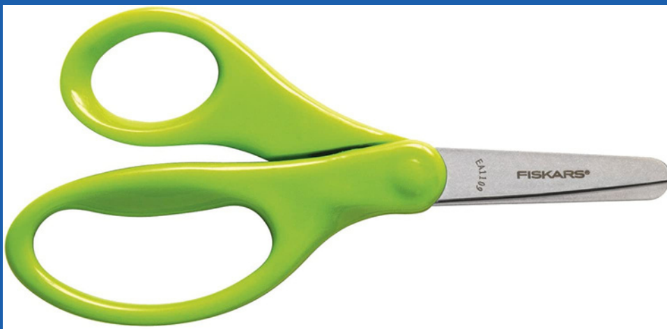
Blunt tip scissors