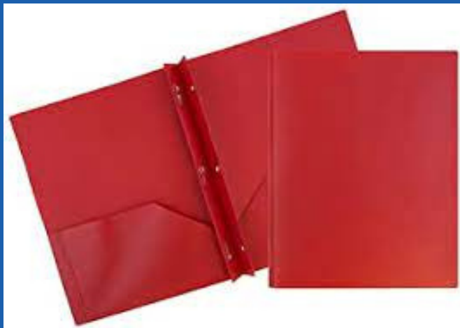
Red pocket folders with brads Carpeta de bolsillo roja con clavijas