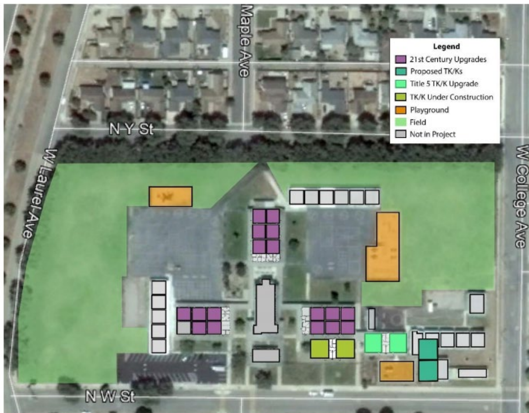
Figure 4: Clarence Ruth Elementary School Site Map

El Consejo también aprobó seguir adelante con Edwards Construction Group para los servicios de construcción y pre construcción de LLB relacionados con las próximas adiciones de salones de TK en Clarence Ruth, Fillmore, Hapgood y La Cañada. A continuación, hay diagramas de cada escuela que muestran la ubicación de los (dos cada uno) nuevos salones (etiquetados como TK propuestos en el reporte). Estos están ubicados muy cerca a los salones de Kinder existentes en cada escuela. También en estos diagramas se encuentran los planes para futuros salones de clases de Pre Kinder (PK), en espera de financiación de bonos, como se describe en la presentación de Universal Pre-Kindergarten.