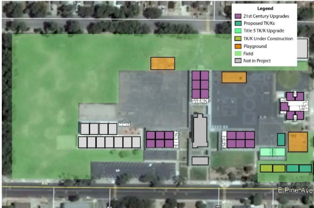
Figure 7: Hapgood Elementary School Site Map