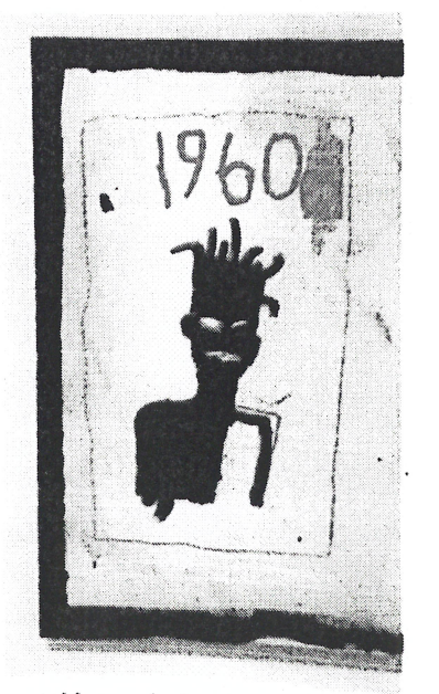
Les tableaux de Jean-Michel Basqui exposées au Musée d'art moderne d

On reconnaît la musique messagère, le twoubadou, le zouk, et le rythme racine comme variétés de musique haïtienne . Écoutez-les en ligne.